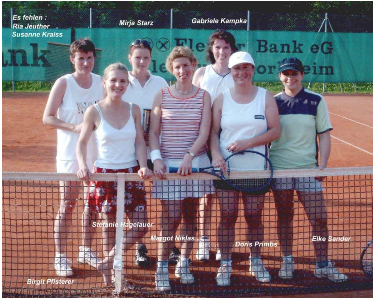
Herren 50 II Meister in der Bezirksklasse 1 und Aufstieg in die Bezirksliga