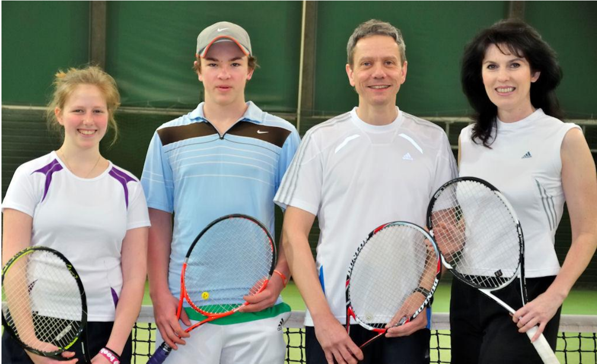
Foto: Chiara Krusenotto, Felix Reichert, Gert Neunert, Gabriele Kampka

Siegerehrung fand im ASV-Restaurant am Wertwiesenpark in Sontheim statt. In gemütlicher Runde mit zahlreichen Teilnehmern und Gästen ehrte der Sportwart Gert Neunert die Sieger und Platzierten und überreichte für die Finalisten die traditionellen Rostbraten-Gutscheine. js