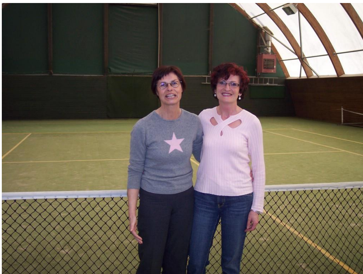
Mixed: G. Kampka/V. Cosic