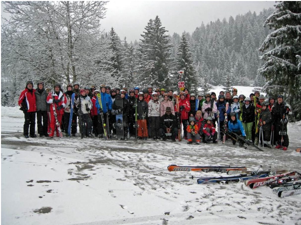
„Ski heil“ für 53 vom TSB Tennisclub Horkheim in Graubünden