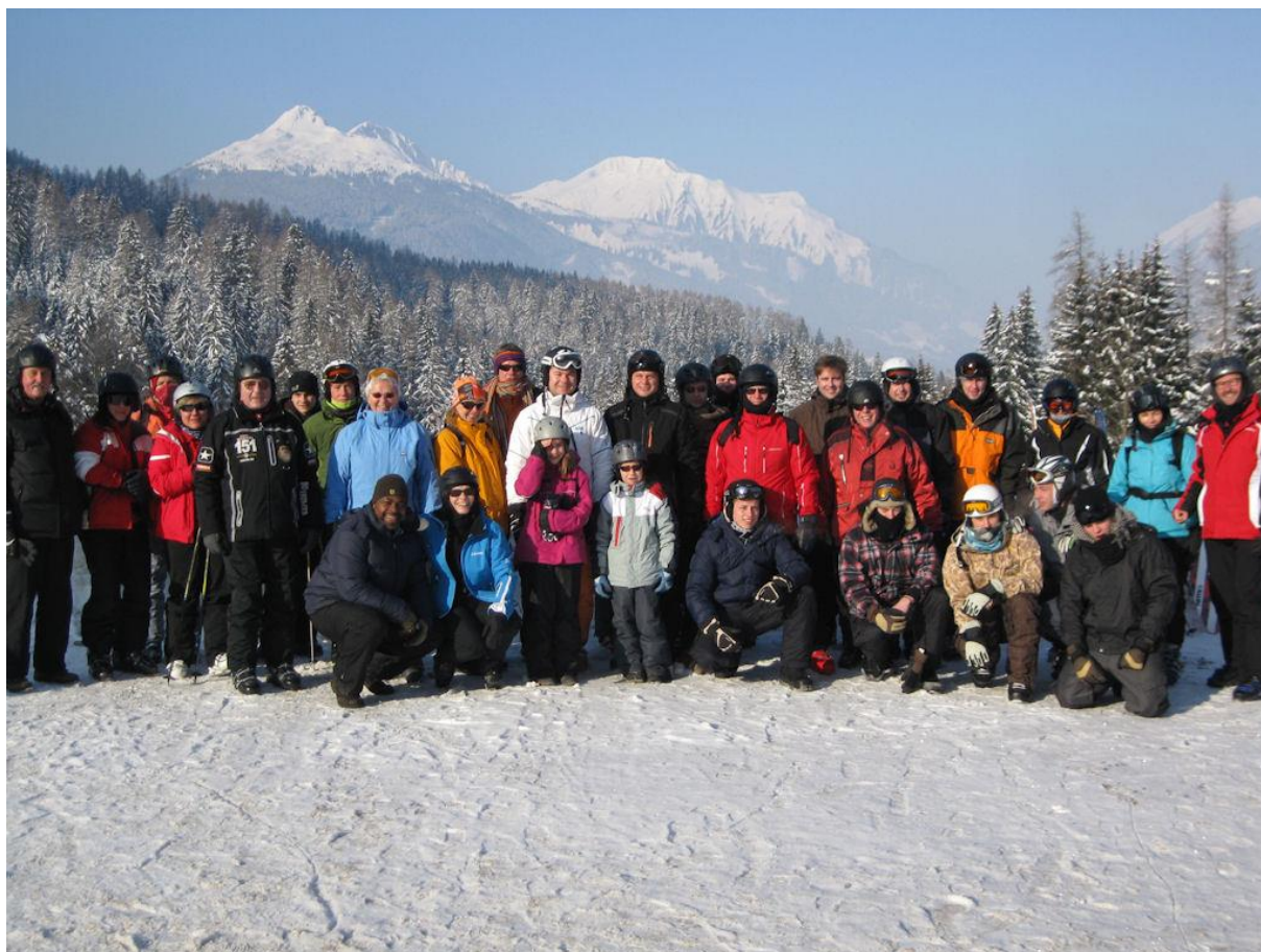
32 Teilnehmer bei der Skiausfahrt.